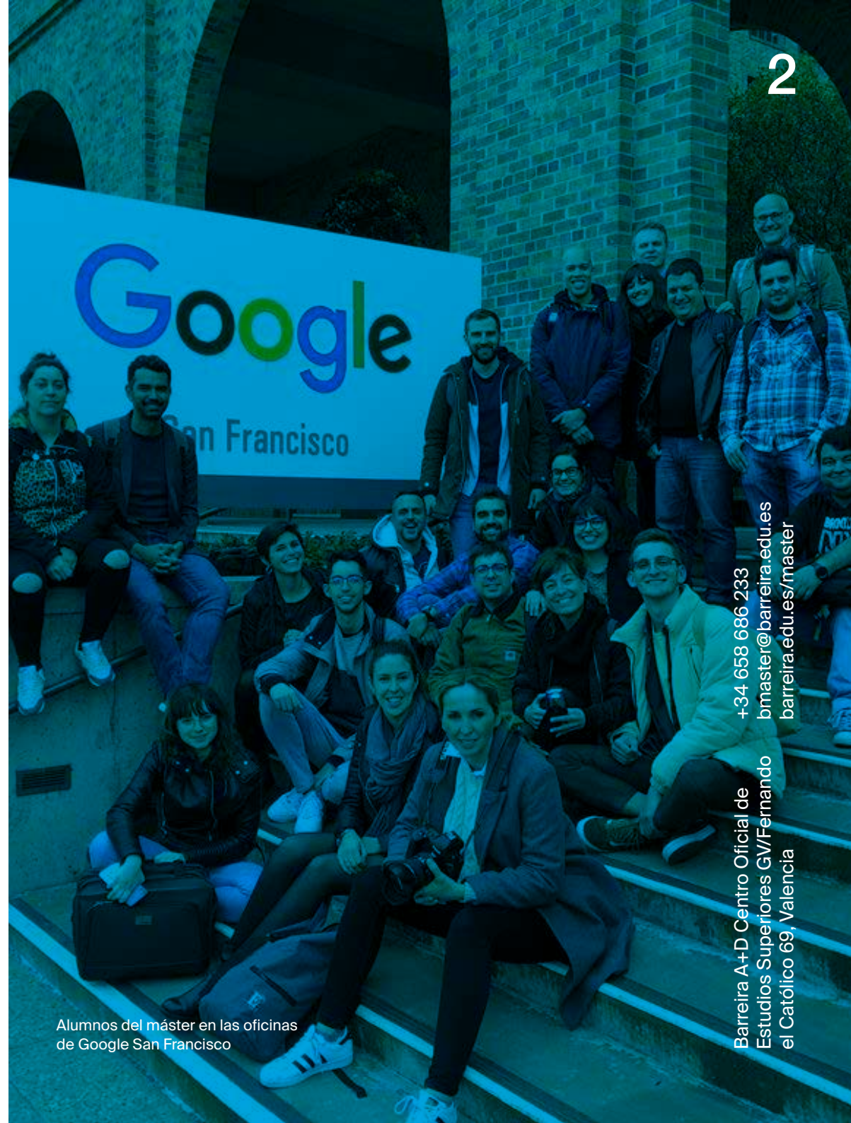
Alumnos del máster en las oficinas de Google San Francisco

Viaje formativo a Silicon Valley (EEUU) y formación en empresas como Google, Airbnb, LinkedIn o Fantasy.. Ver página 5 del dossier para más información.