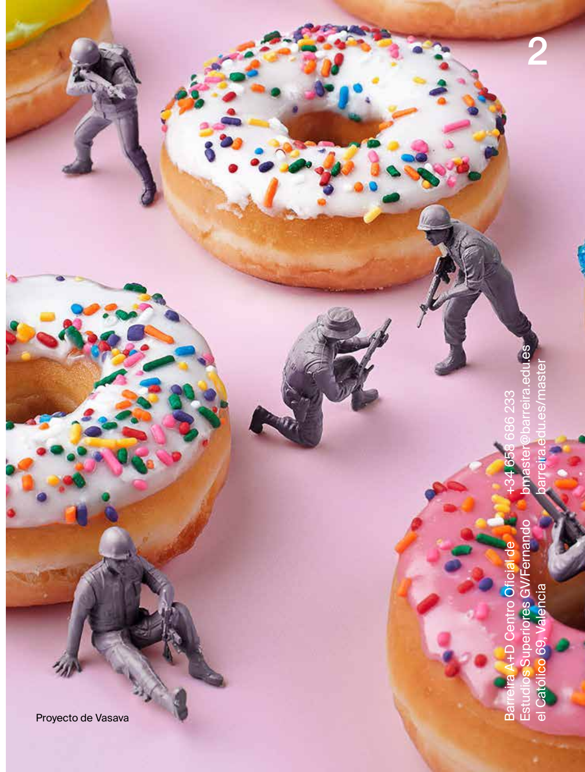
Proyecto de Vasava

Barcelona y Nueva York, incluidos en el precio.