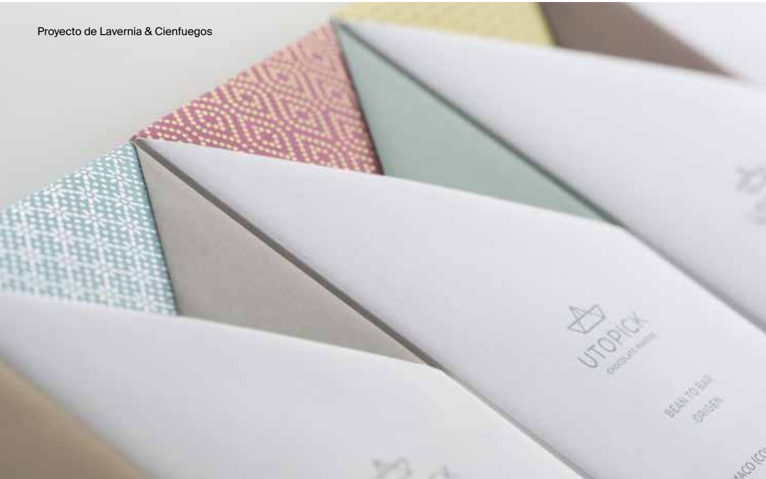
Proyecto de Lavernia & Cienfuegos

Desarrollar un proyecto de Creación y Dirección de Arte de una campaña publicitaria creada a partir de un brief. Este trabajo se realizará en duplas creativas y nos acercaremos a los conceptos más innovadores de comunicación a través de los canales que están en continuo cambio. Conseguiremos la creación de un proyecto de comunicación gráfica publicitaria acercándonos a la realidad de una agencia de publicidad.