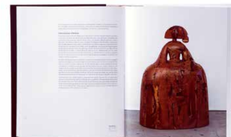
Proyectos de Gimeno Gràfic