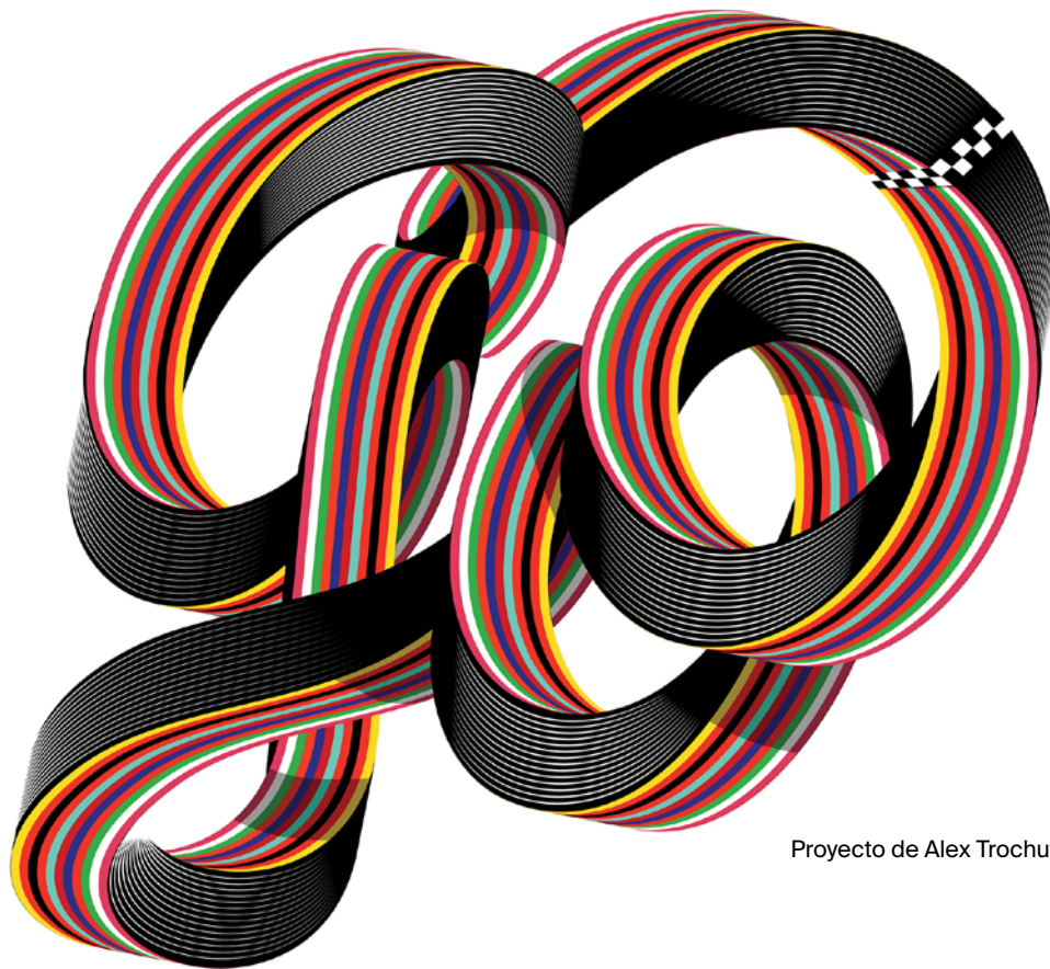
Proyecto de Alex Trochut

(Transporte y alojamiento incluido en ambos viajes).