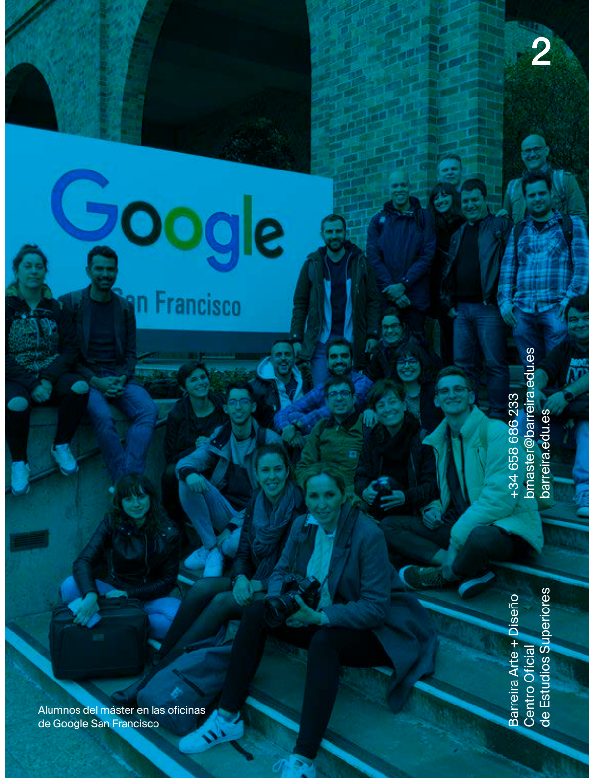
Alumnos del máster en las oficinas de Google San Francisco

El estudiante de los másteres online de Barreira A+D dispone en todo momento del apoyo de un gestor que sirve de nexo entre estudiantes y profesores, de un tutor personal que se encargará de resolver por correo o teléfono sus dudas, y un campus virtual en que el se encuentran centralizados todos los recursos necesarios para el seguimiento de las clases. Además, Bemore Service pone al alcance de nuestros estudiantes material complementario y servicios como la bolsa de trabajo que enriquecen todavía más la experiencia de cursar el máster.