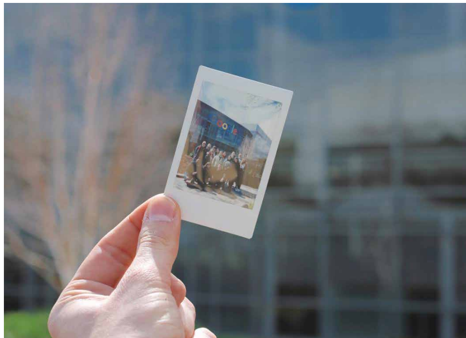
Alumnos en las oficinas de Google San Francisco

La defensa del TFM se realizará ante un tribunal compuesto por profesionales de empresas de diseño de producto digital.