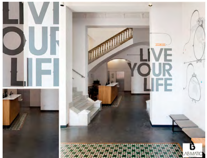
Imagen: ST. CHRISTOPHER'S INNS HOSTEL BARCELONA de LABMATIC ESTUDIO