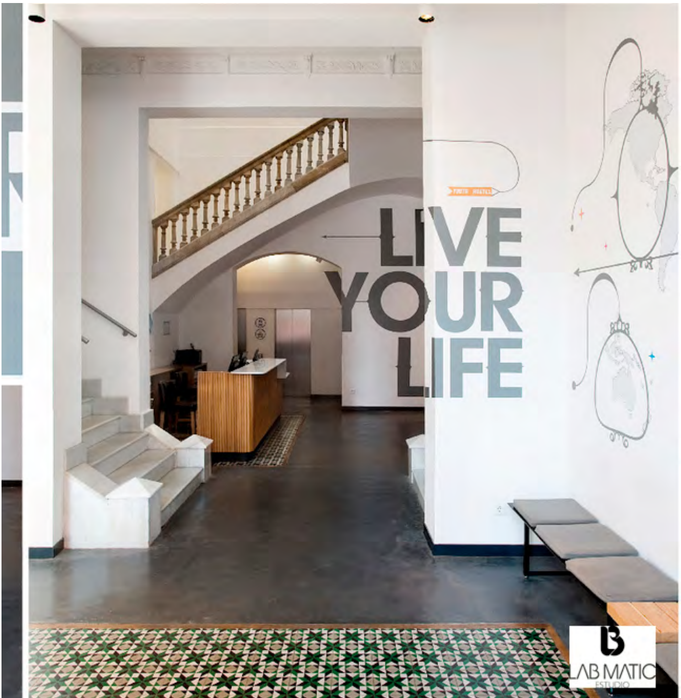
Imagen: ST. CHRISTOPHER 'S INNS HOSTEL BARCELONA de LABMATIC ESTUDIO